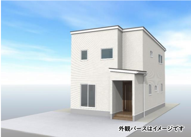
外観パースはイメージです